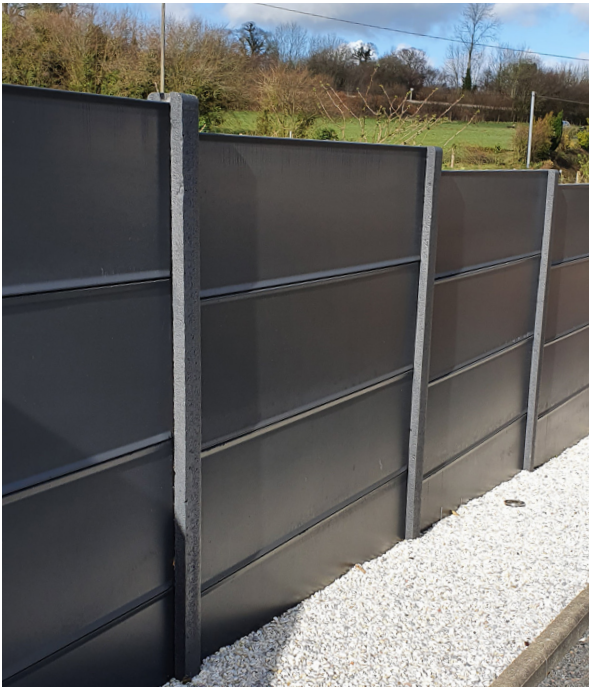
Clôture Classique, coloris Anthracite