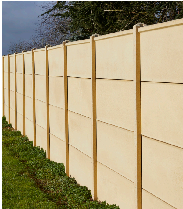
Clôture Classique avec chaperon scellé, coloris Ton pierre