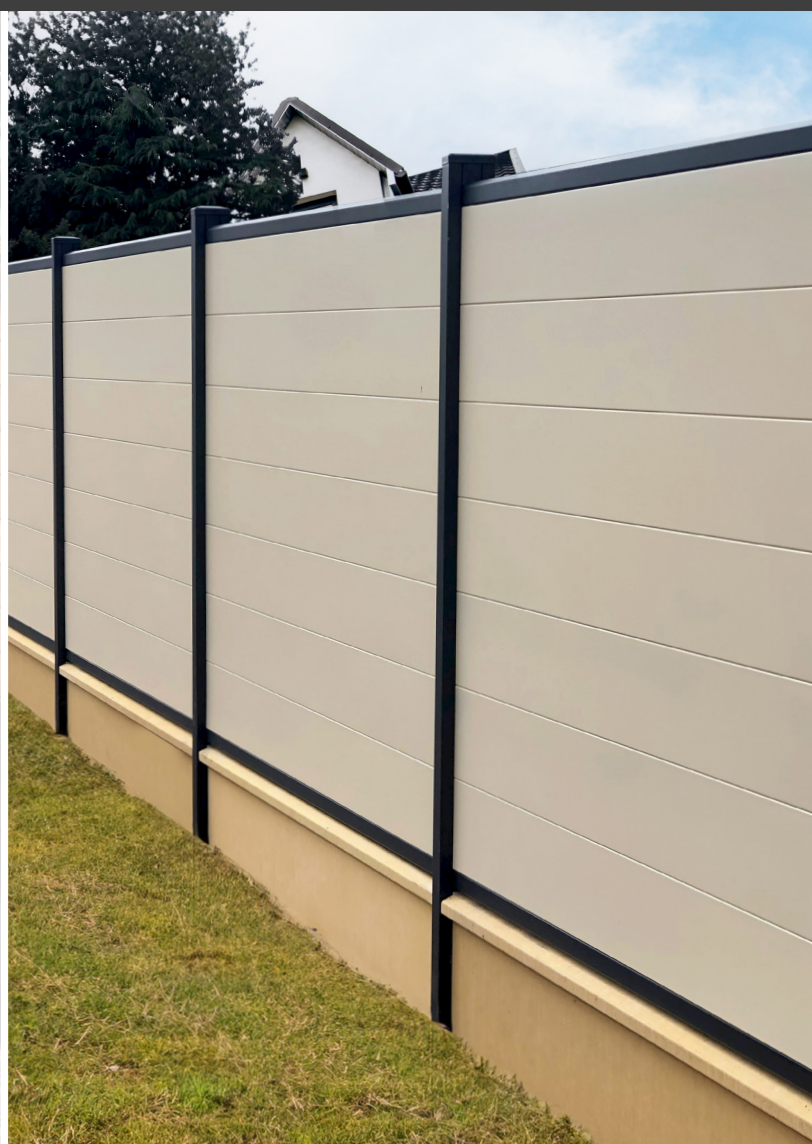
Clôture composite avec plaques de soubassement ½ chaperon ton pierre