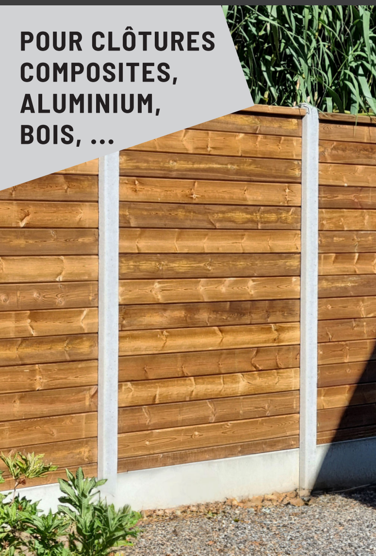
Clôture bois avec plaques de soubassement droites gris béton